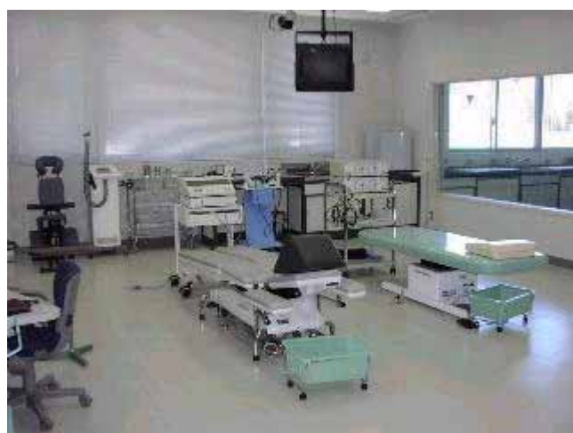
視聴覚治療室（イメージ）